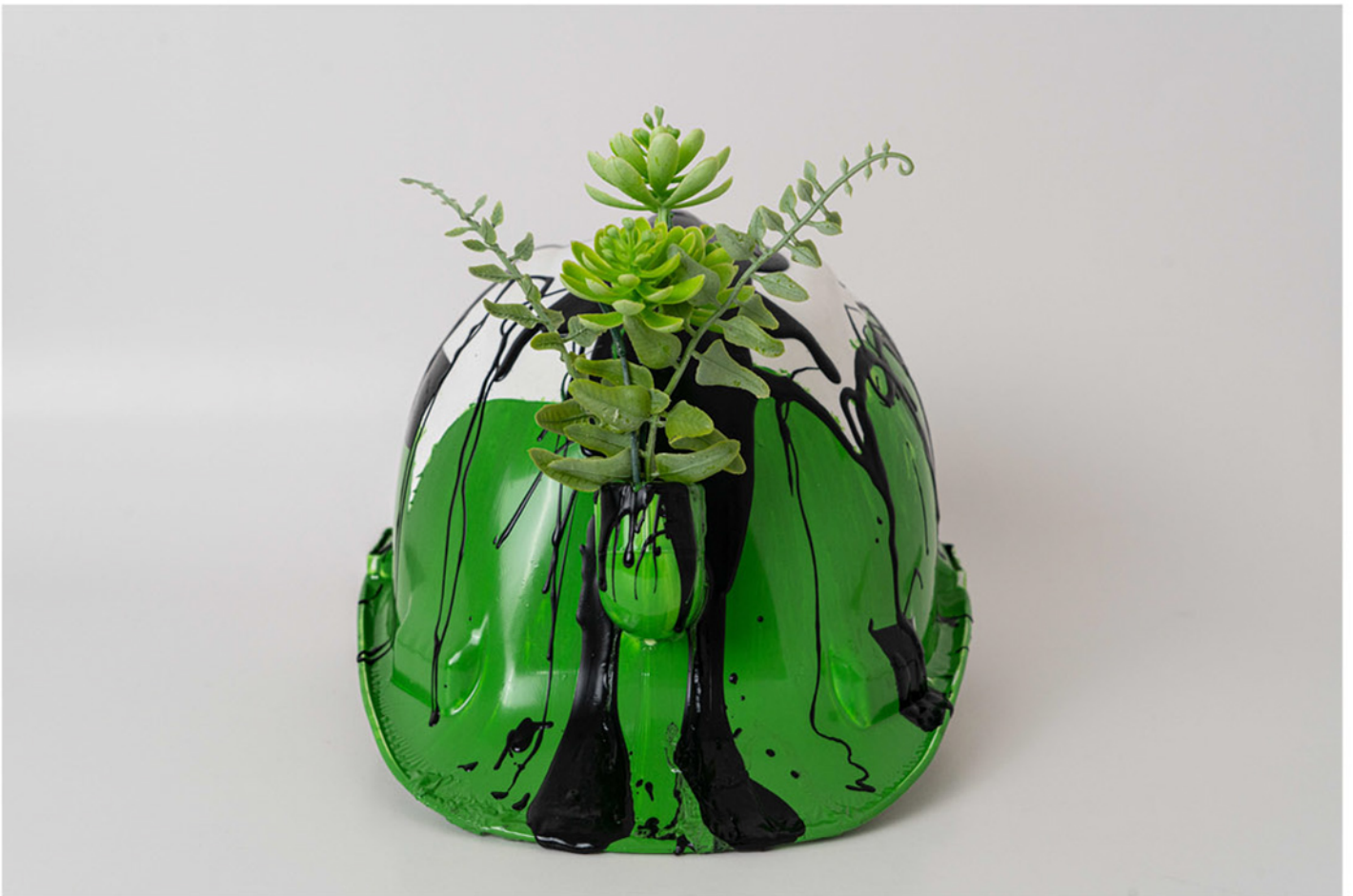
Peyzaj Mimar Landscape Architect, 2021