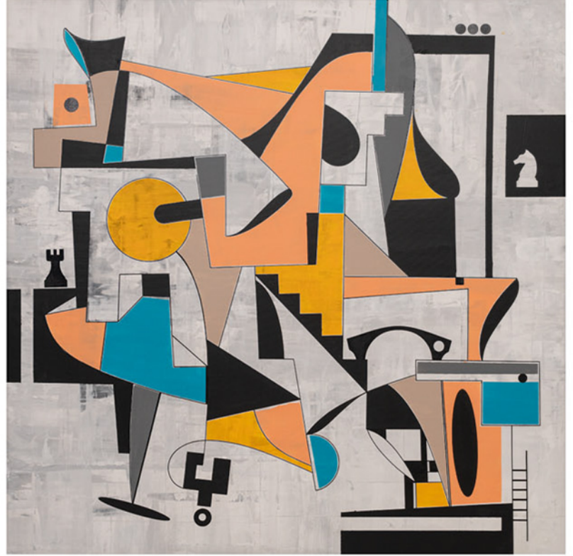
Strateji Zamanı Strategy Time, 2021 tuval üzerine karışık teknik mixed media on canvas 106 x 106 cm

UMUT ŞUMNU : Uzun yıllar iç mekân ve ürün tasarımıyla uğraşan biri olarak plastik sanatlara olan ilgin nasıl başladı?