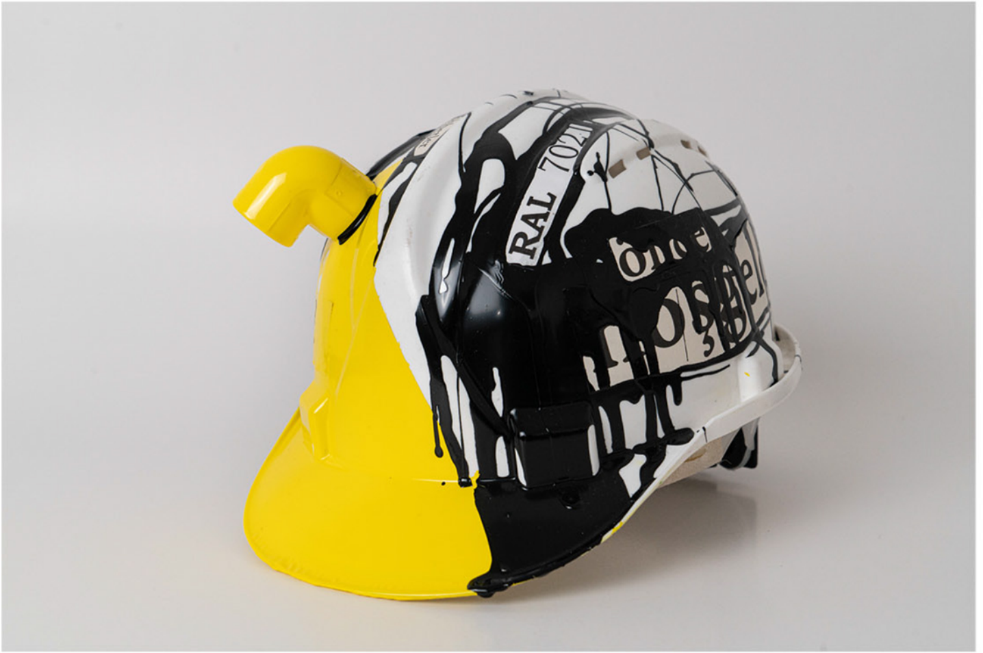
Yansın Işıklar Let the Lights Come On , 2021

U. Ş. : Baret üzerine müdahale yapma fikrinden söz edelim. Bu fikir ne zaman ve nasıl doğdu? Baretle çalışmak biçim ve içerik anlamında sana nasıl bir potansiyel ya da sınırlılık yarattı?