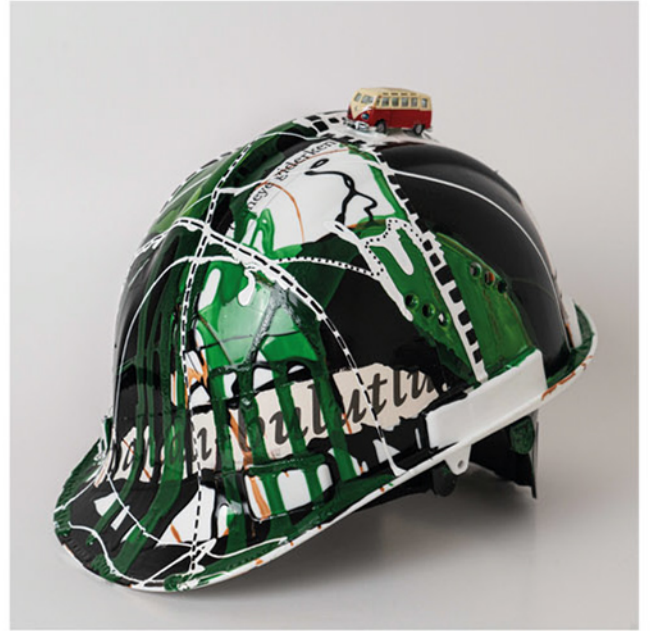
"Kafa İzni" , 2021