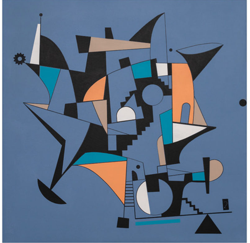
Hassas Dengeler Delicate Balances, 2021 tuval üzerine karışık teknik mixed media on canvas 106 x 106 cm

UMUT ŞUMNU : Being a person who has been dealing with interior and product design for many years, how did your interest in plastic arts begin?