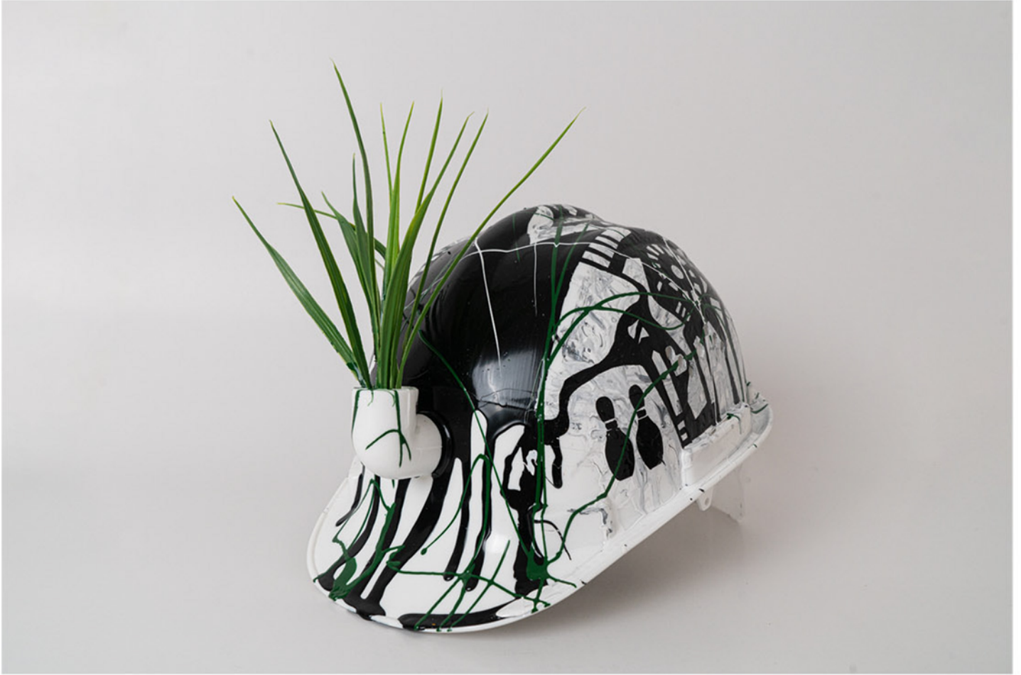
Kralmış Gibi As If He was a King , 2021

U. Ş. : Let's talk about the idea of intervention on the safety helmet. When and how was this idea born? What kind of potential or limitation did working with the safety helmet create for you in terms of form and context?