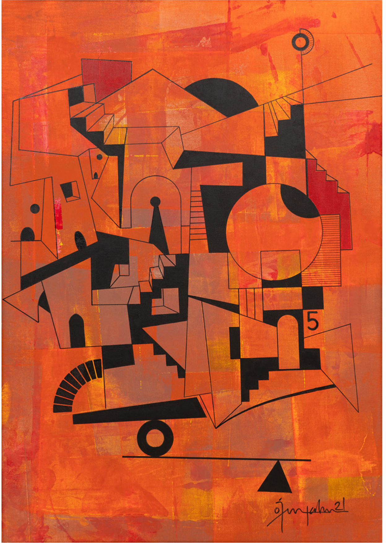
Inşılı Çıkışlı With Ups and Downs, 2021 tuval üzerine karışık teknik mixed media on canvas 90 x 65 cm