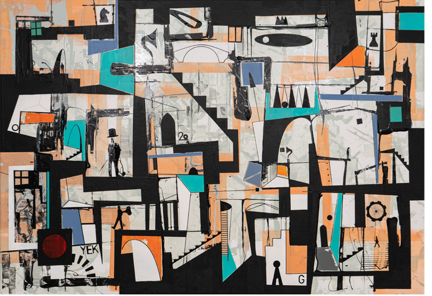
Sıradan Bir Gün An Ordinary Day , 2021 tuval üzerine karışık teknik mixed media on canvas 105 x 148 cm