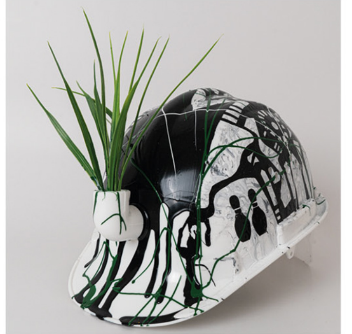
Kralmış Gibi As If He Was a King , 2021