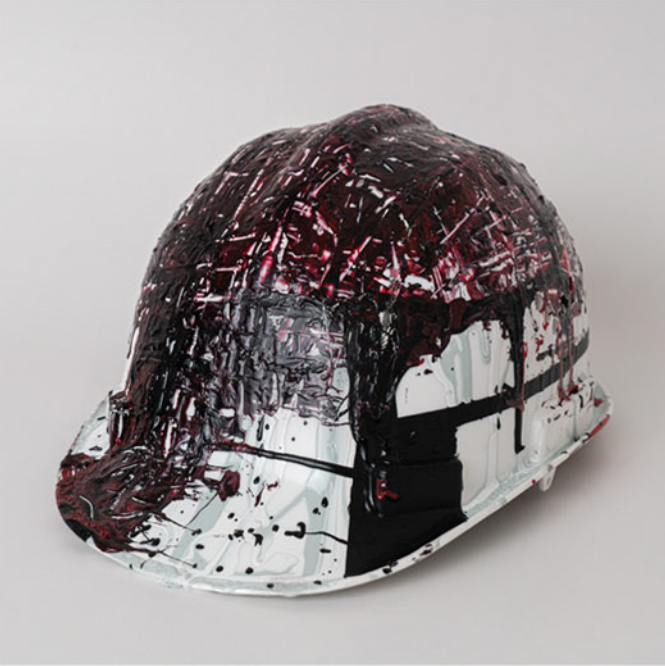
Kalıpçılar Moulders , 2021