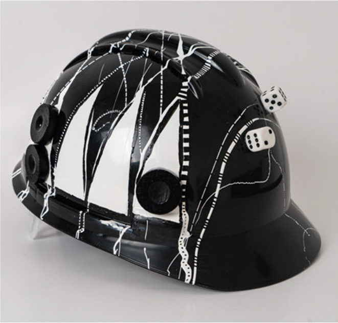
"Dubara" , 2021