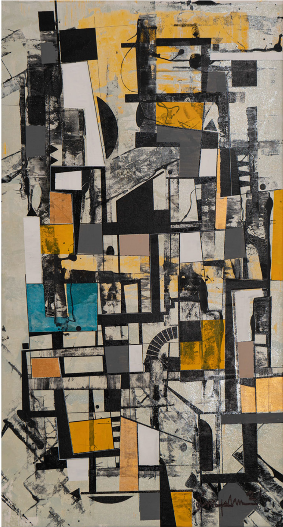
Bazen Geri Geri Sometimes Backwards , 2020 tuval üzerine karışık teknik mixed media on canvas 135 x 75 cm