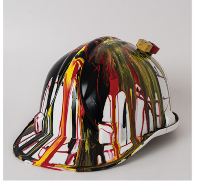
"Cem" Şantiyede Büyük Patlama Huge Explosion at Construction Site , 2021