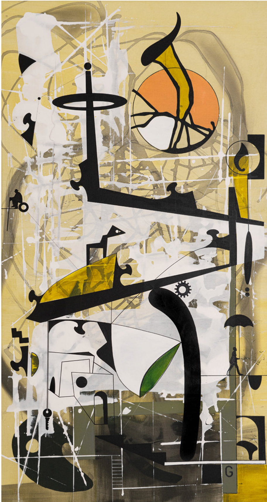
Fanteziler Fantasies , 2021 tuval üzerine karışık teknik mixed media on canvas 135 x 75 cm